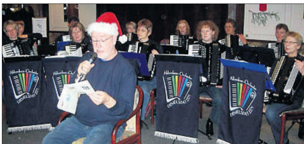
Musikalische Weltreise: Die Diemelspatzen spielten vor den Bewohnern der Seniorenresidenz ars vivendi auf.